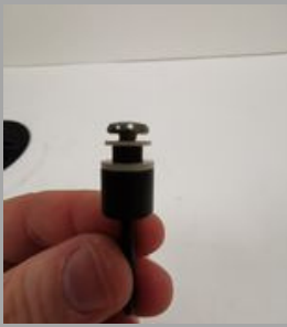
3. ΠΨ<Ψ ΨΨ<ΠΨ< (μΨ<).