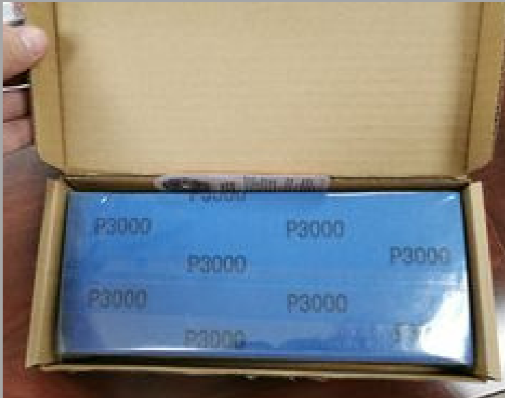
ጠቅላይ ፍጥረት ስራ