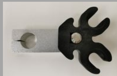
የሰው ልብ ለብ ስራ ለማድረግ የሚያስፈልጉ ስልጠናዎችን ያዘጋጁ።