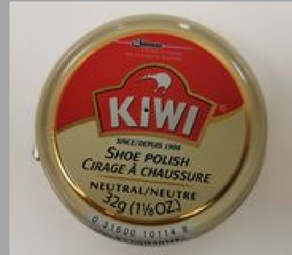
ፍጥረት ስራ ለማድረግ