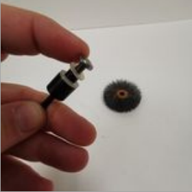
4. ΨΨ<ΠΨ<ΠΔΨ<Ψ< ΔΨ<Δ.