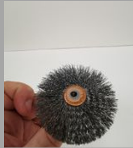
8. Δርጋጋ ጋሜሪሪ ስሞርኤሞር ጠላሞር.