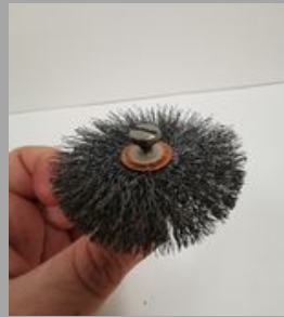
11. ለሪሪሪሪሪሪሪ ለጋሪሪሪሪሪሪሪሪ, ስሞርኤሞር ለጋጋጋ ለጋጋሞርጋጋጋ, UL ለሪሪሪሪሪሪሪሪሪ ለሪሪሪጋጋ ጉር 10-ጋጋ.