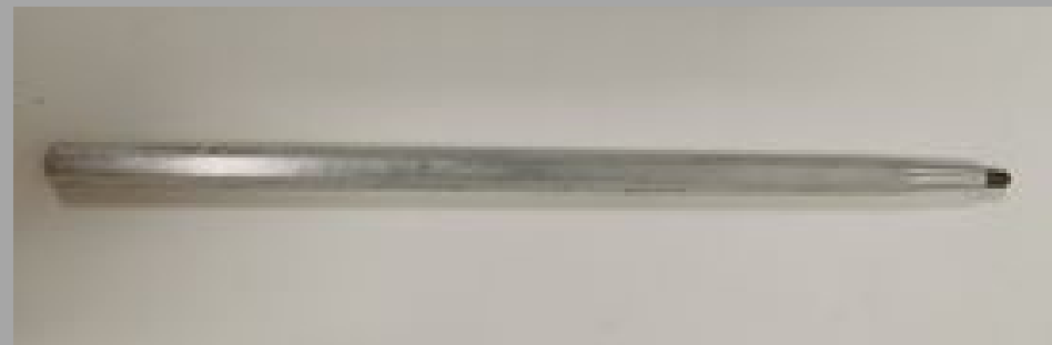
ጠቅላይ ስራ ለማድረግ