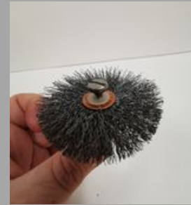
9. ርዎሪጋጋ ስሞርኤሞር ጠላሞርጋጋጋ.