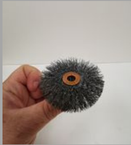
7. በጋጋ Δδርርሞር Δርጋጋ ስሞርኤሞር ጠላሞር Δርሪሪጋጋ.