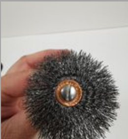
10. ሪኔበሪጋጋ ስሞርኤሞር ጠላሞርጋጋጋ. Δδርሚ Δርፋ ለጋሪሪጋጋ ለጋጋሞርጋጋጋ.