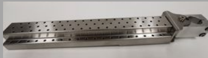
የሰው ልብ ለብ ስራ ለማድረግ የሚያስፈልጉ ስልጠናዎችን ያዘጋጁ።