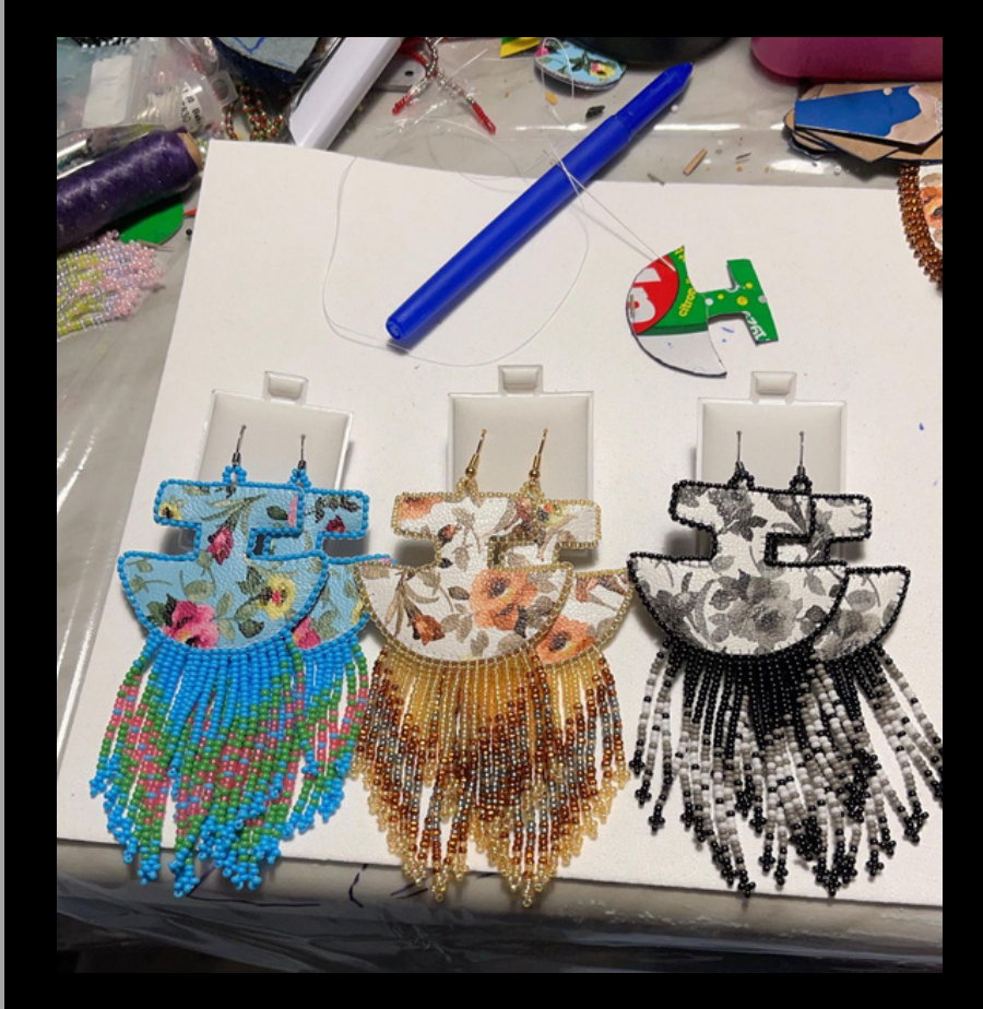
Boucles d'oreilles perlées en forme de uluk