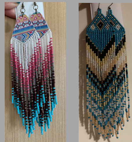
Boucles d'oreilles perlées