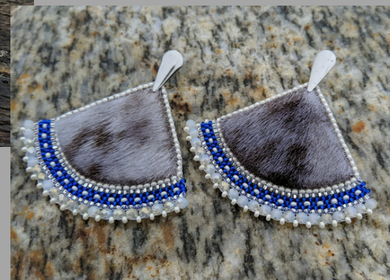
Boucles d'oreilles perlées avec de la peau de phoque