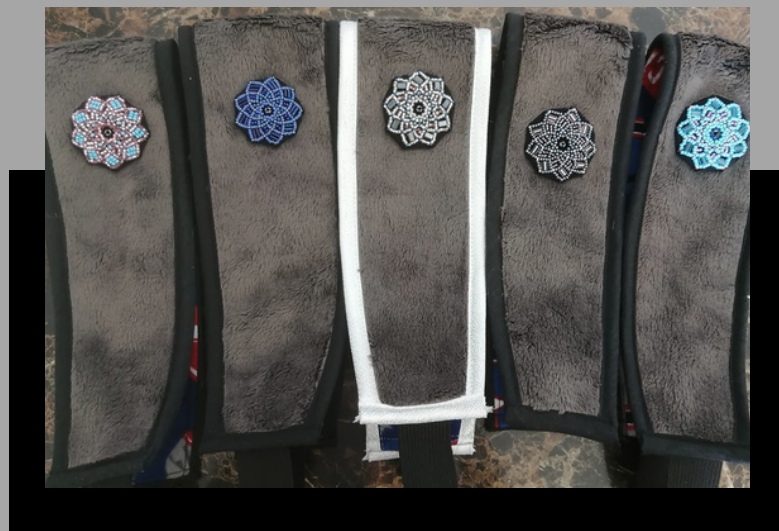
Accessoires avec fleurs perlées

Louisa est une jeune artiste qui est née en 1991 à Puvirnituq et qui habite maintenant à Inukjuak depuis 2011. Elle utilise le thème des fleurs et des uluks dans son perlage et préfère faire des appliqués pour ensuite les coudre sur différents morceaux de vêtements comme les mitaines, les bandeaux et les sacs à mains. Louisa aime également faire des accessoires tels des porte-cartes avec un design en perles. Il est possible de retrouver ses oeuvres en perlage sur sa page Facebook privée.