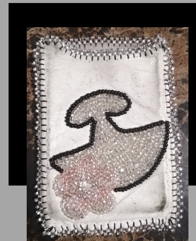
Uluk perlé sur un porte-cartes