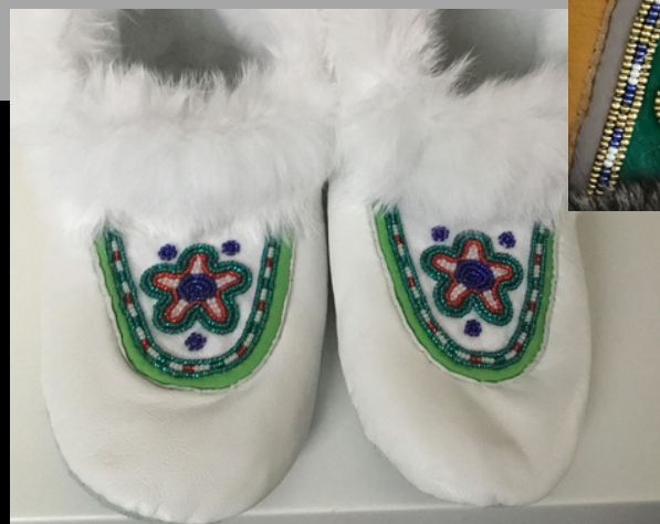
Pantouffles avec empeignes (qalliniit) perlées