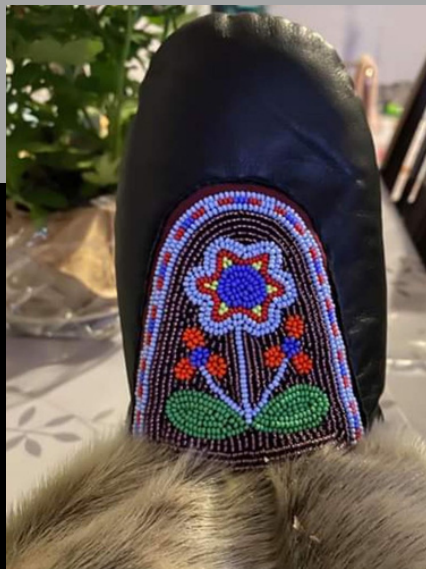
Empeignes (qalliniit) perlées