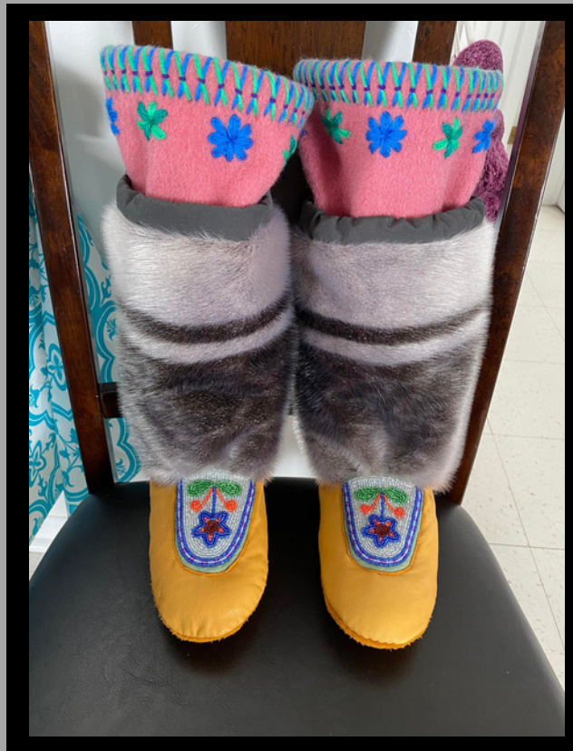
Paire de kamik avec empeignes (qalliniit) perlées

Elle aimerait que les élèves apprennent de son travail, qu'ils essaient de faire quelque chose de facile qui leur donnera envie d'en faire plus.