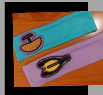
Bandeau avec kakivak et uluk en perles