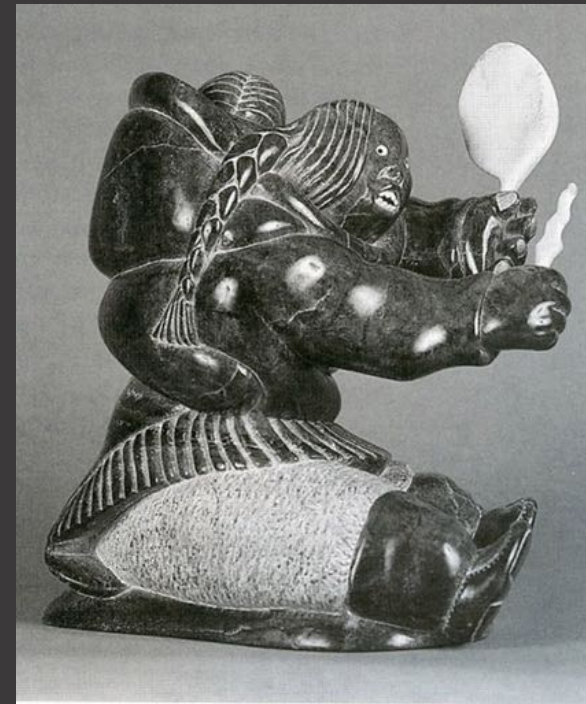
"ՎԵՍԵՑԵՅԵ ԳՐԸԾԿԻՆ" ՎՃՃՆՆՆԻՐԸ