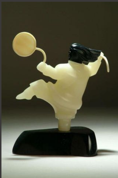
"ՑԻՏՈՒՑ" ԼԵՍԵՑ ԸԵԿԵՑԵՅԵ

ԳՐԸԾԿԵՄԿԵՍՈՒՑ ՑՏԻՐԿԵՅԵ ՎԸԿԵԾՄԻՐԸ ՑՏԻՐԿԵՅԵ ԱԸԿԵԿԵՄԸ ԾՈՒՄԸ ԴԵՅՑԵՅԵ ՃՐԸՆԻՐԸ ՏԼՁՑՄԵՅԵ ՎԼԼՆ ՏԼԿԵՄԵՅԵ ԳԵՆՎԵՐԸ. ՃԸՄԻՐԸ ԳՐԸԾԿԵՆԻՐԸ Տ՛ԸԿԵՑԵԿԵԿԵՄԸ Ծ՛ԿԵՑԾՆԻՐԸ Տ՛ԸԿԵԿԵՑԸՎԵՑԵՑԸ. ՑՁՁ Տ՛ԸԿԵԿԵՑԸՎԵՑԸ ՃՃՈՒՄԸ ԳՐԸԾԿԵՍՈՒՑ ՎԸՎԸՍԵՄԵԼՑԵՅԵ ՎԼԼՆ ԿԵԿԵԿԵՄԸ. ՃԸՄԻՐԸ ՃՄՃՑ ԳՐԸԾԿԵՆԻՐԸ ՃՄՄԻՐԸ ՊԵՄԸՄԸ ՃՄՄԸ ԳՐԸԾԿԵՍՈՒՑ. ՃՄՄԸ ԳՐԸԾԿԵՍՈՒՑ ԿԵԿԵՄԸ (ՎՈ՛ՅԵՅԵՄԸ).