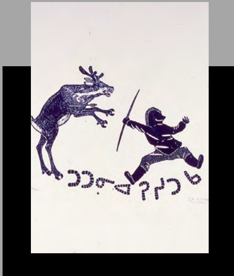
« Une méthode traditionnelle de chasse au caribou » 1974

Tivi est né en 1929 dans un camp à Qirnituartuq, près de Kangiqsualujjuaq. Il est artiste, illustrateur, sculpteur et graveur. Enfant, il dessinait avec du sable et un bâton. Ses premières oeuvres étaient principalement basées sur les animaux et les villages et ses oeuvres ultérieures avaient pour thèmes des êtres surnaturels et des légendes. Il a été choisi pour aller à l'atelier d'imprimerie de Puvirnitug en 1972 et a commencé à faire des estampes à partir de ce moment. Il a été le premier graveur inuit à faire paraître une collection de ses propres estampes. Sa biographie (World of Tivi Etok: the Life and Art of an Inuit Elder), écrite par Jobie Weetaluktuk, a également été publiée en 2008.