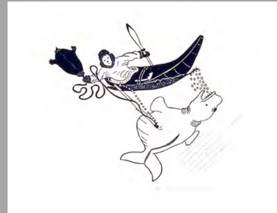
« Chasseur en kayak harponnant une baleine » 1978