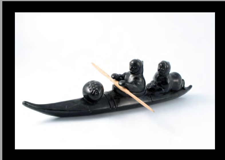
« Chasser en kayak » 2005

« L'intérêt pour les estampes inuites tient davantage au sujet qu'aux compétences techniques de l'imprimeur. Pas avec Thomassie Echalook. Ses estampes témoignent d'une discipline et d'une maîtrise remarquables de la ligne. » (Virginia Watt 1976:5).