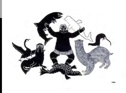
« Voyez ce que je vois quand je n'ai pas de harpon » 1973