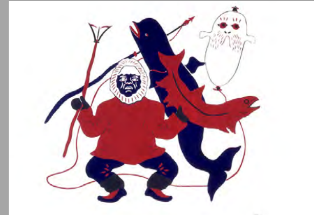
« Le chasseur » 1973