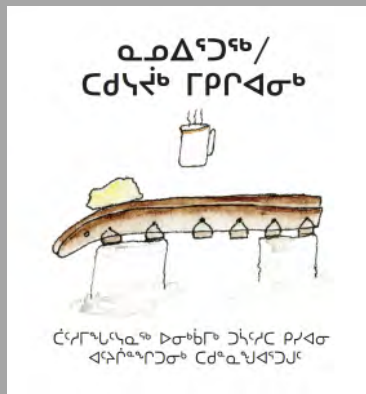
Couverture du livre « Nanuirtuq/Takusaijuuk mikigianik » 2017