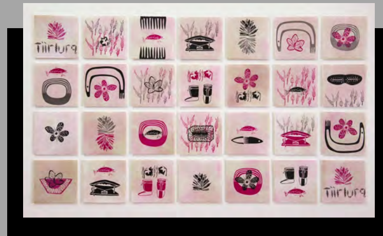
« Convergence Nord/Sud » 2017