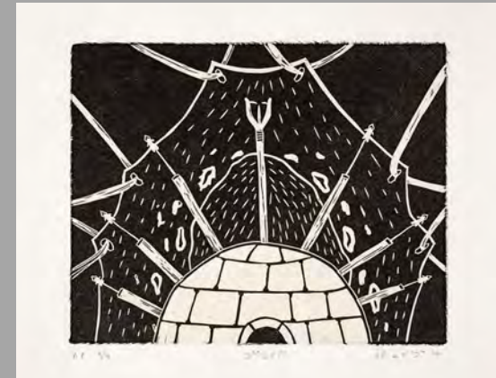
« Demeure » 2016