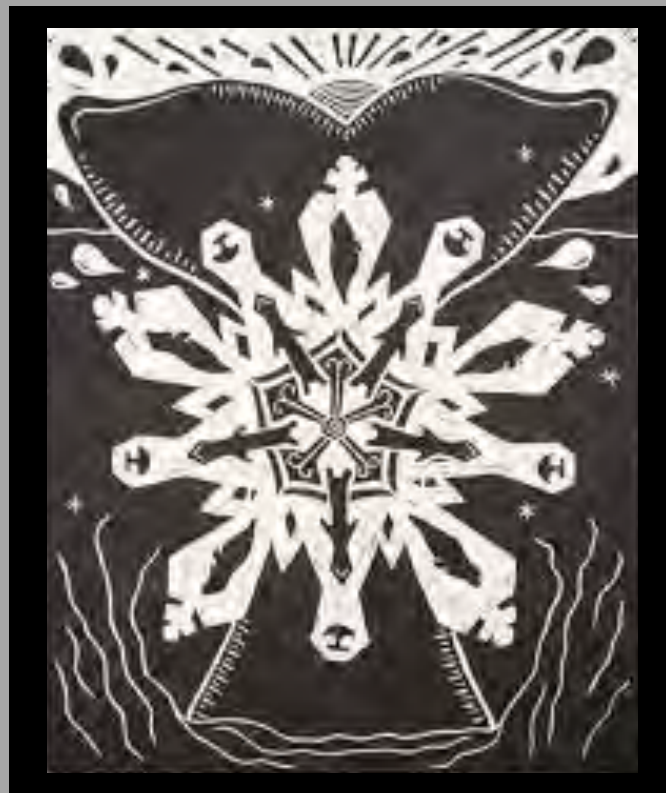
« Flocon de neige » 2016