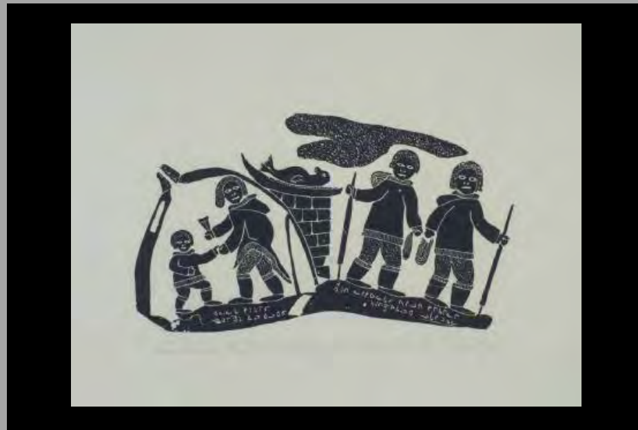
« Femme nettoyant les vêtements d'un garçon et deux hommes allant à la chasse au phoque »