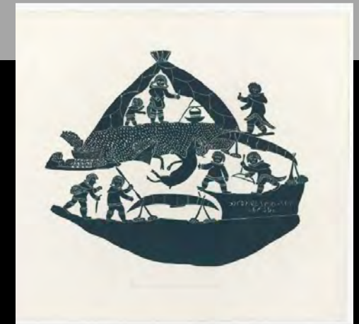
« Camp de chasse au caribou » n.d.