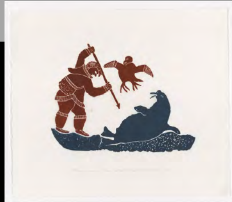
« Près de la famine, l'homme tue sa proie » n.d.