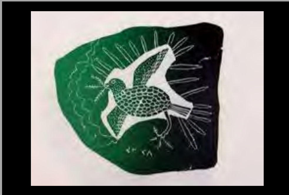
« Oiseau du printemps » n.d.

« Il décrivait souvent le vent dans ses dessins avec des lignes ondulées, des traces de pas traînaient derrière une silhouette pour montrer comment elle était arrivée là. » (Mitchell, 2004)