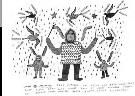
« Différentes sortes d'animaux » 1985