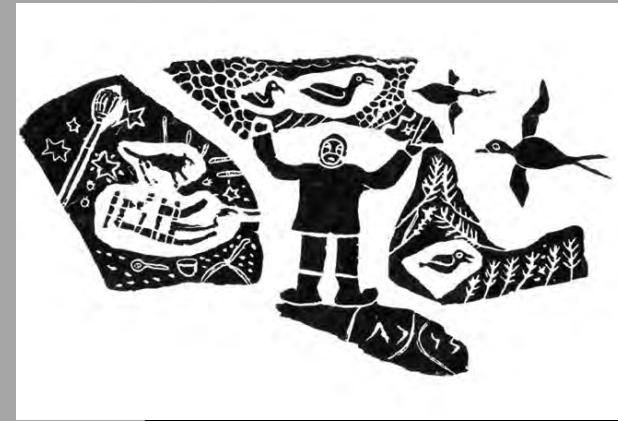
« Il se souvient avec bonheur de tous ses autres printemps » 1987