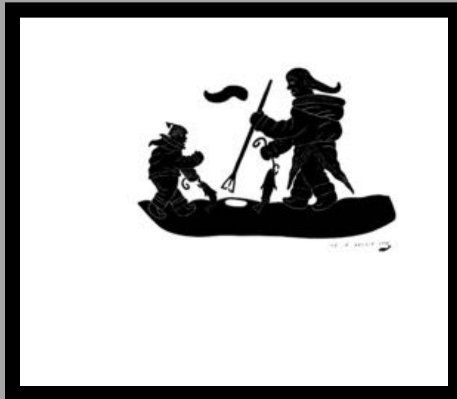
«Կրթության Կրթություն» 1973

«Գեղարվեստի Կրթություն»-ը 1992-ի ընթացքում Կրթության նախարարության կողմից Կրթության նախարարության կողմից Կրթության նախարարության կողմից