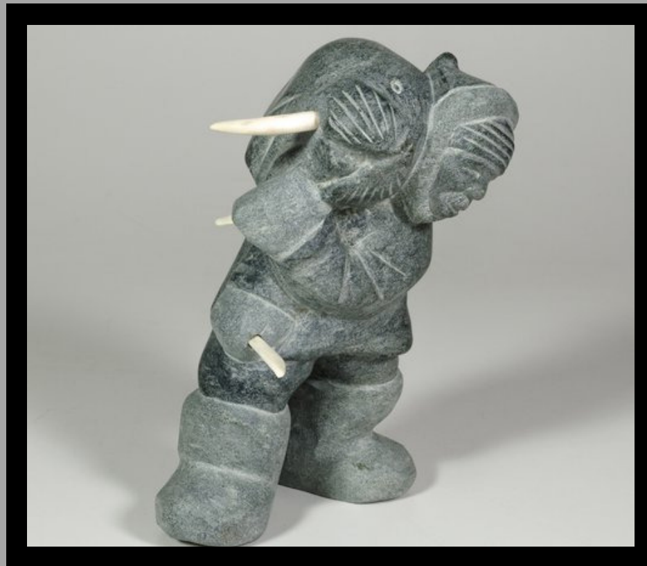
« Chasseur de morse »

Il est reconnu comme l'un des sculpteurs les plus doués de Salluit.