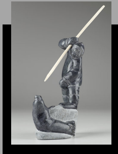
« Chasseur et phoque » n.d.