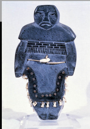
« Femme en tenue traditionnelle » 1977