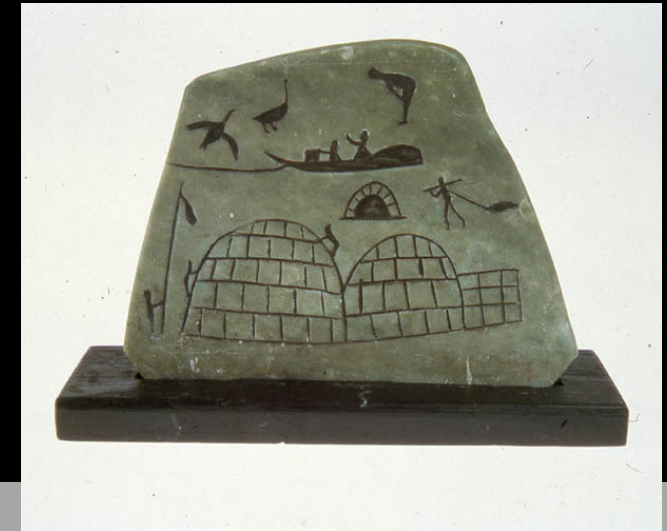
« Scènes de chasse » 1955