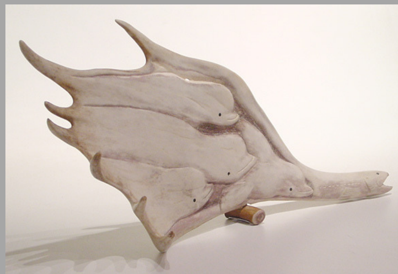
« Bélugas et loutres chassant un poisson » n.d.