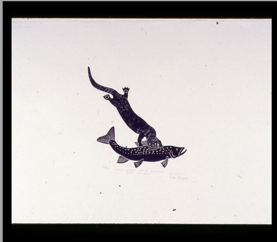
« Sans titre » n.d.