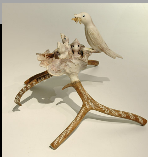
« Oiseau nourrissant ses petits » n.d.