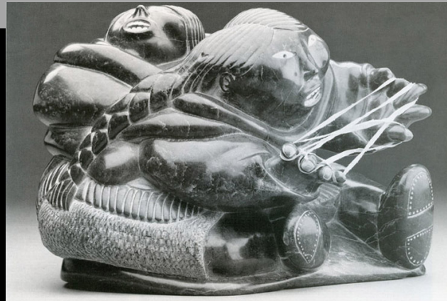
« Femme jouant à un jeu de ficelles » 1987