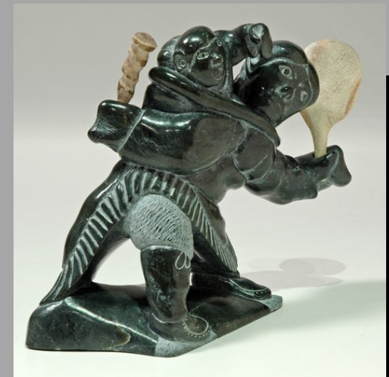
« Danse du tambour mère-enfant » nd