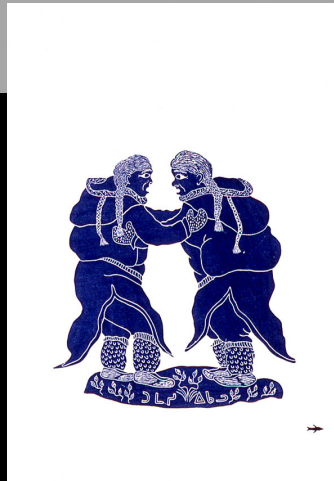
« Deux femmes faisant des chants gutturaux » 1975