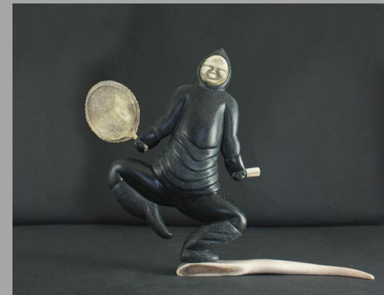
« Danseur au tambour » 2007