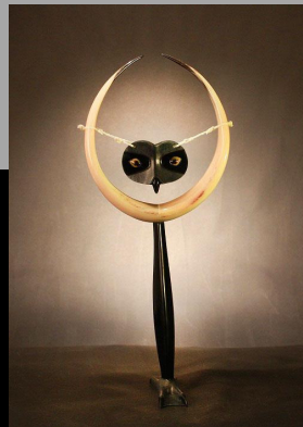
« Okpik » 2007