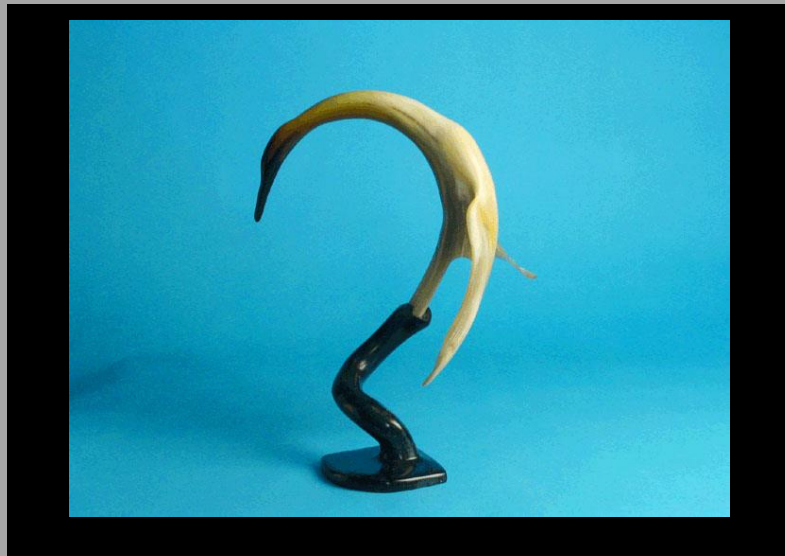
« Élégance » 2006