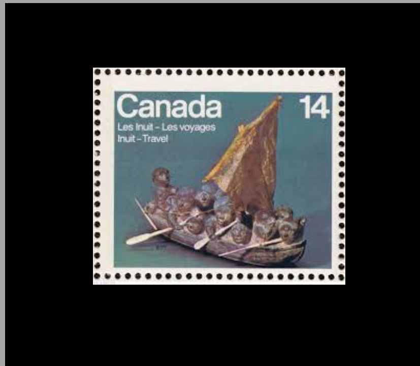
Timbre de la « migration » 1976

Fait intéressant à propos de l'artiste L'une de ses sculptures sur le thème de la « migration » a été illustrée sur un timbre canadien de 14 cents en 1976.