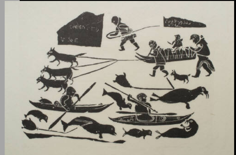
« Chasse aux phoques en kayak » 1963