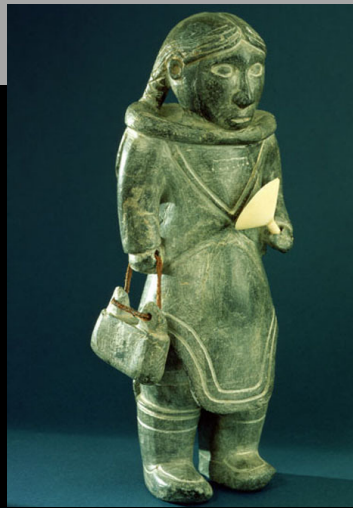
« Femme debout » 1960-1976