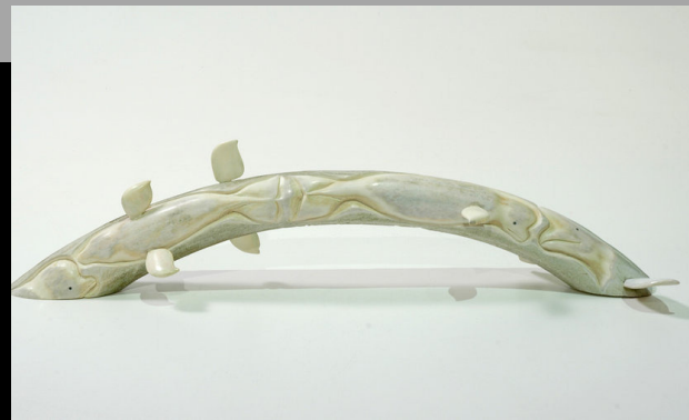
« Un groupe de bélugas » n.d.