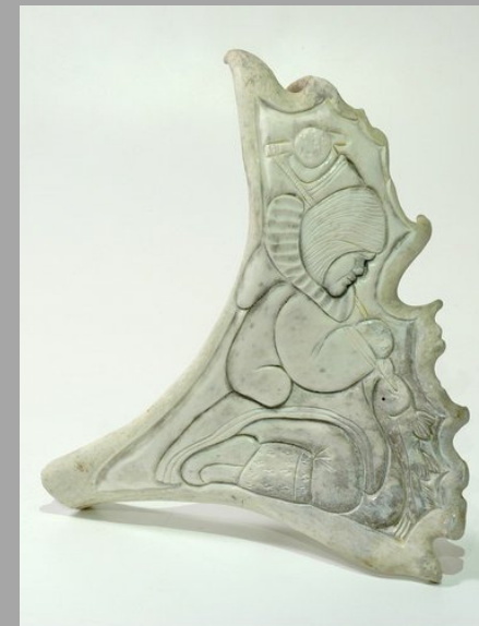
« Femme pêchant sur glace » n.d.