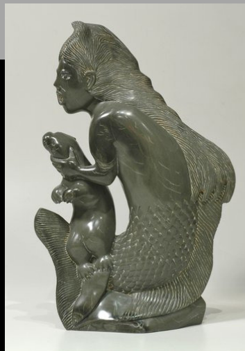
« Sedha avec loutre » n.d.