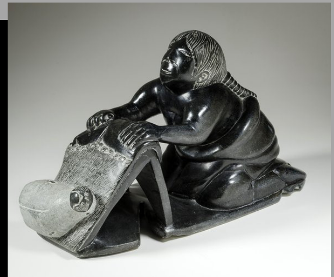
« Femme dépeçant une peau » n.d.